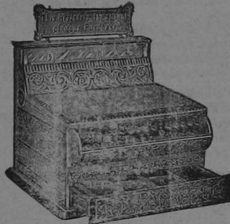
Para pormenores ocórrase á MACAYA Y CA.—UNICOS AGENTES San José de Costa Rica

Todo aparato está garantizado y su precio relativamente equitativo recomienda su compra.